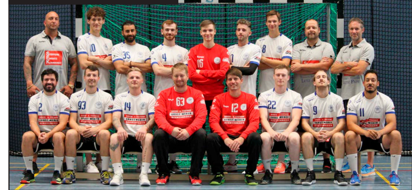
Die 1. Herrenmannschaft der SG Rechtenbach